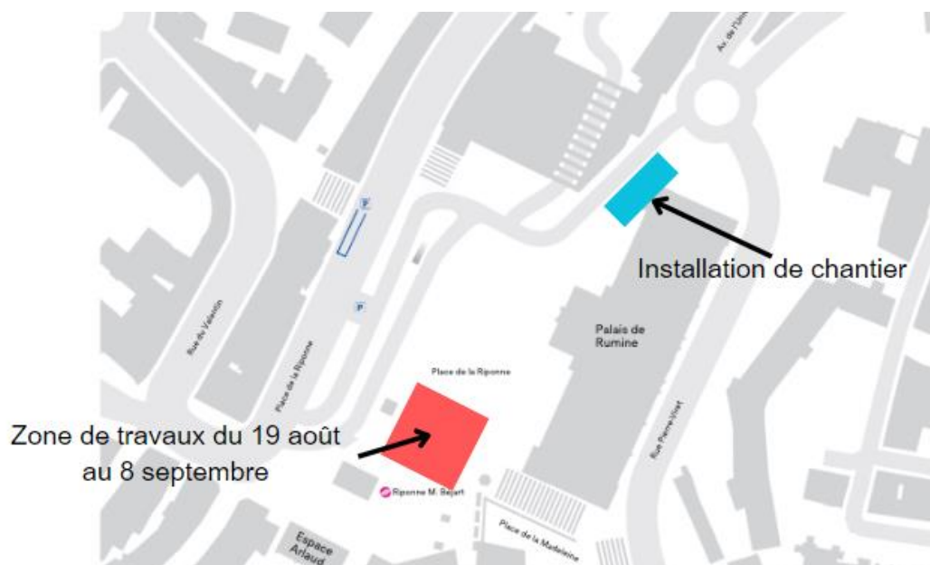
Image d'illustration. Les zones effectives des travaux et de l'installation de chantier peuvent varier légèrement de l'image ci-dessus.

Les travaux sont prévus en deux phases. La première phase commencera le 19 août 2024 et durera jusqu'à la fin de l'année. Les travaux se concentreront alors sur la partie Est de la place, du côté du Palais de Rumine. La première étape des travaux, qui aura lieu jusqu'au 9 septembre, se fera sur une petite portion de la place, autour de la fontaine, selon les images d'illustration ci-dessous et l'installation de chantier prendra place sur le bas de l'avenue de l'Université :